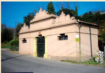
"Ipogeo dei Volumni" - Ponte San Giovanni - PG

Dipartimento di Scienze Storiche sezione Scienze Storiche Antichità Università degli Studi di Perugia.