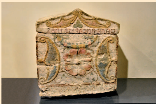
Urna Cineraria di Thana Ancari - Antiquarium del Palazzone - PG

Assessore alla Cultura e alle Politiche Sociali del Comune di Perugia