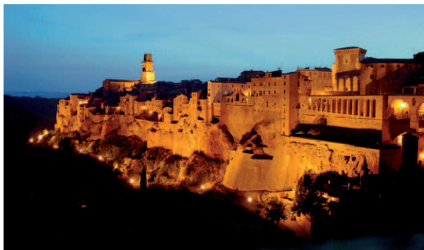
Pitigliano - Veduta notturna

prenotazione obbligatoria - info a pag.10