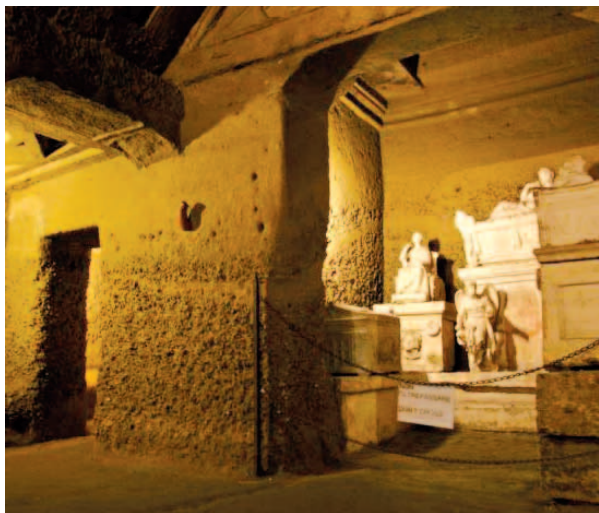
"Ipogeo dei Volumni" - Ponte San Giovanni - PG

domenica 5 settembre ore 10.00/13.00 - 15.00/20.00